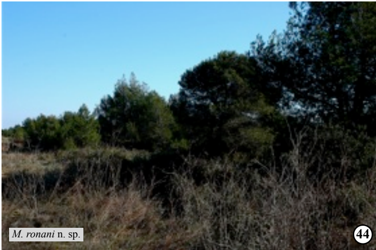
M. ronani n. sp.